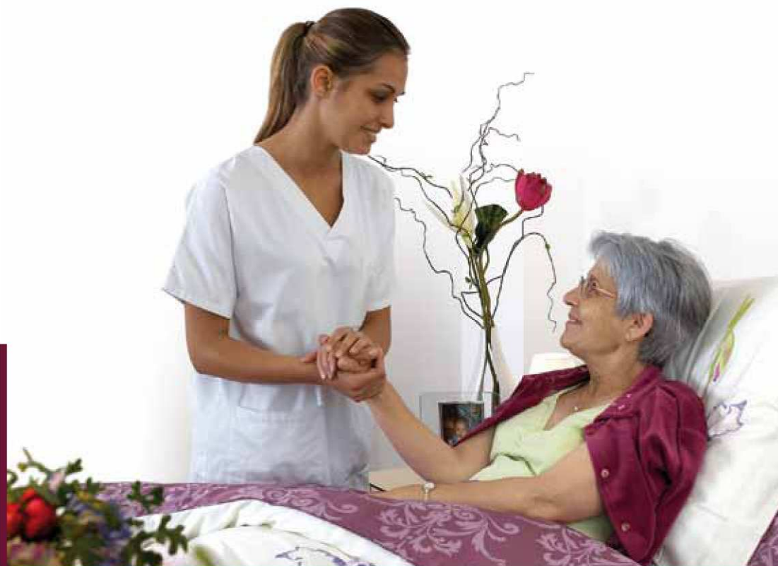
łóżko AvantGuard 800 Comfort